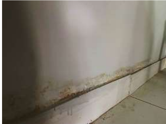
Fotografía N°15: Presencia de humedad vertical y caliche en las hiladas inferiores