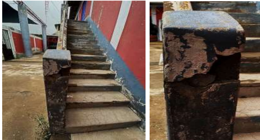
Fotografía N°06: Pilar inferior con desprendimiento de concreto, baranda con presencia de oxido y escalones con existencia de fisuras, desprendimiento de concreto y deficiencias estructurales

Presenta desprendimiento de concreto en el pilar inferior grietas; fisuras y desprendimiento del concreto en los escalones existencia de oxido en la baranda de hierro (Fotografía N°06); grietas y fisuras verticales en el pilar superior (Fotografía N°07). Encontrándose así en un mal estado de conservación la escalera en su totalidad.