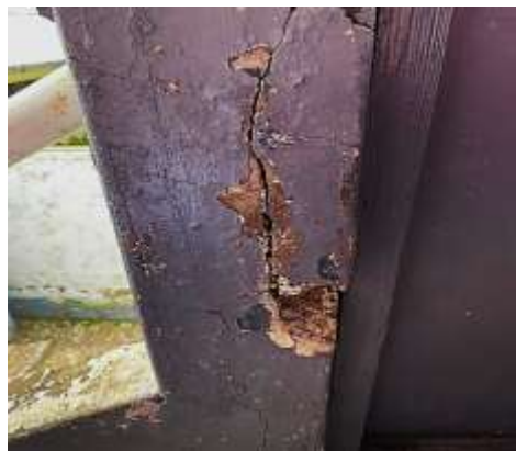
Fotografía N°07: Pilar Superior con presencia de grietas, fisuras verticales y deficiencias estructurales.