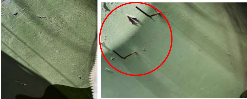
Fotografía N°28: Existencia de fisuras y desprendimiento de la pintura.

2.8. Pabellón 4: El pabellón 4 cuenta con 2 aulas para los alumnos. Material de bloqueta en muros y techo de calamina con revestimiento de cartón prensado. Se encuentran en buen estado de conservación. En muros el revestimiento exterior se encuentra con fisuras y desprendimiento de pintura (Fotografía N°28).