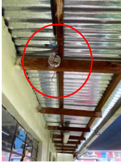
Fotografía N°25: Deficiencia en instalaciones eléctricas.