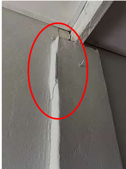
Fotografía N°23: Existencia de grietas en las columnas, deficiencias estructurales.