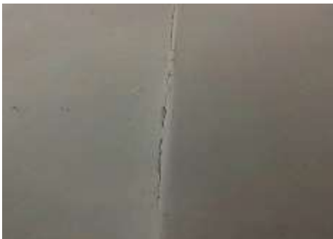
Fotografía N°12: Fisuras verticales en unión de muro divisorio. Deficiencia estructural.