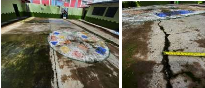
Fotografía N°08: Presencia grietas, humedad y maleza.

El piso de la losa es de material de concreto, presenta grietas de aproximadamente 1 pulgada. También se puede observar la existencia de moho y maleza en el concreto. (Fotografía N°08).