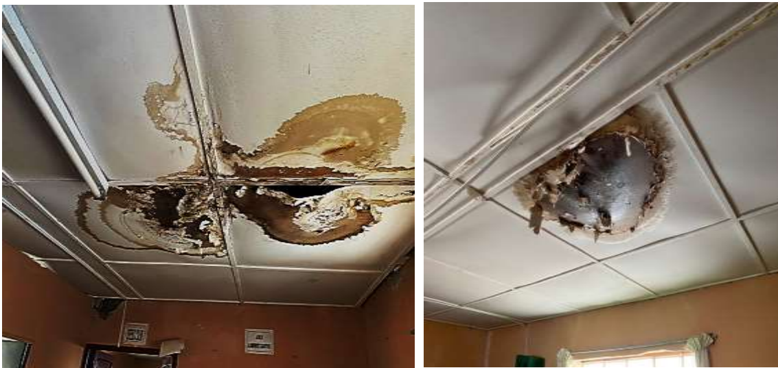
Fotografía N°19: El techo se encuentra en mal estado de conservación presentando humedad y aberturas.