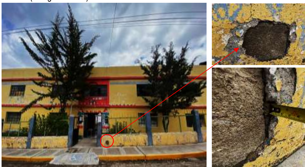
Fotografía N°01: Desfragmentación del concreto.

El día 07 de marzo del presente año, me apersoné a verificar el estado situacional de la I.E.I. Micaela Bastidas. En el frontis del ingreso de la I.E.I. Micaela Bastidas se aprecia que el muro presenta fisuras y desfragmentación del concreto como también caliche por la humedad de la zona. (Fotografía N°01)