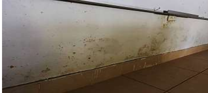
Fotografía N°22: Presencia de caliche en las hiladas inferiores.