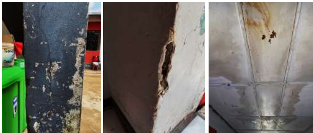
Fotografía N°04: Detalle de grietas, desprendimiento de concreto, presencia de moho y deficiencias estructurales

Las columnas presentan grietas y desprendimiento del tarrajeo. El techo se encuentra la existencia del moho. (Fotografía N°04).