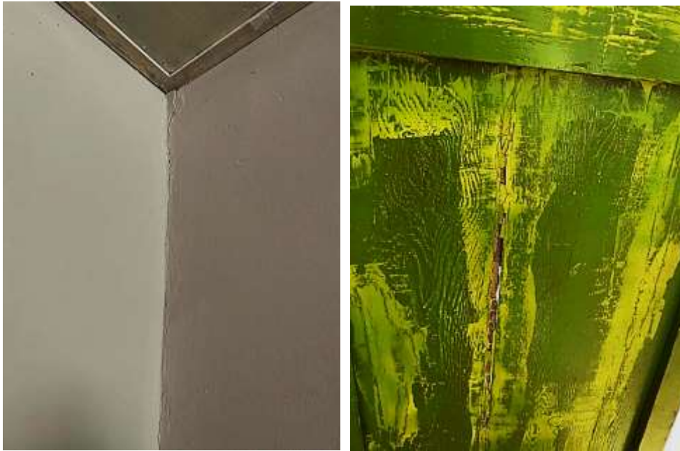
Fotografía N°18: Fisuras Verticales en muros divisorios y mal estado de conservación en la puerta de madera.