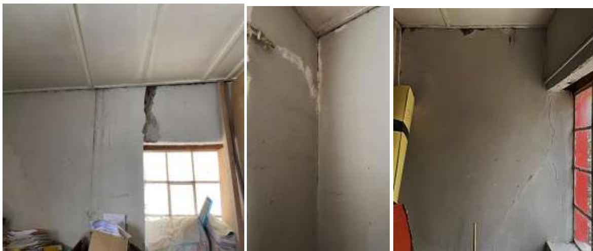
Fotografía N°20: Los muros presentan grietas verticales en unión de muro divisorio, grietas diagonales, desprendimiento de material de adobe, deficiencias estructurales, encontrándose en un mal estado de conservación