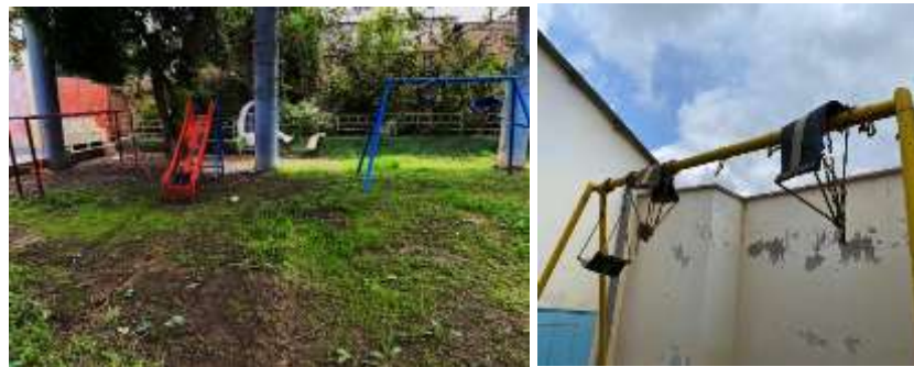
Fotografía N°09: Presenta oxidación del acero en cadenas y tubos.

Presenta 4 juegos recreativos, uno de ellos presenta oxidación en el acero y defectuoso en las cadenas que sostienen los asientos (Fotografía N°09).