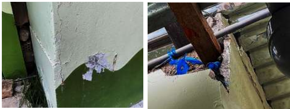
Fotografía N°17: Presencia de caliche en muro; en la parte superior se observa grietas verticales y desprendimiento del adobe donde se sostiene viga de madera.