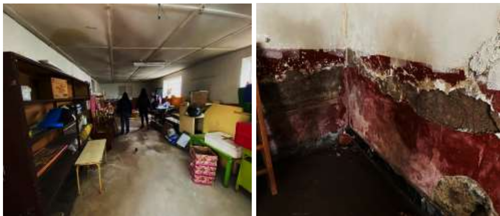
Fotografía N°10: Presencia de humedad, deficiencias estructurales, en mal estado de conservación