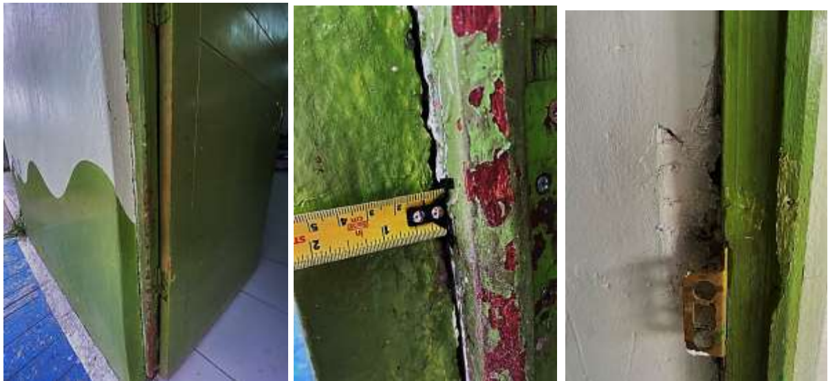
Fotografía N°16: Detalle de grieta en unión de muro divisorio con el marco de la puerta, el marco de madera se encuentra en mal estado de conservación.