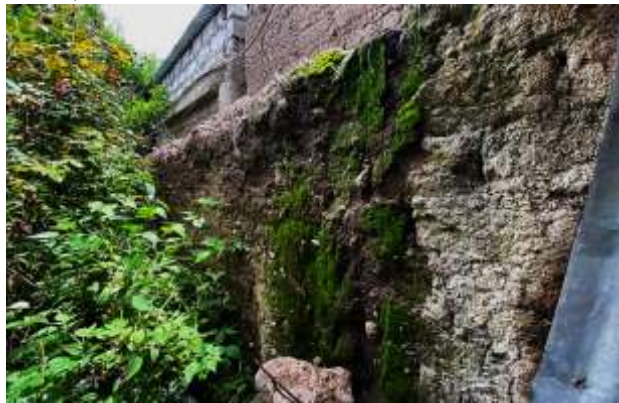
Fotografía N°03: Presencia de moho verde

No existe cerco perimétrico en los laterales de la I.E.I. Micaela Bastidas, por lo que solo se encontró un muro de adobe de 2.00m con presencia de moho verde en la parte trasera. (Fotografía N°03)