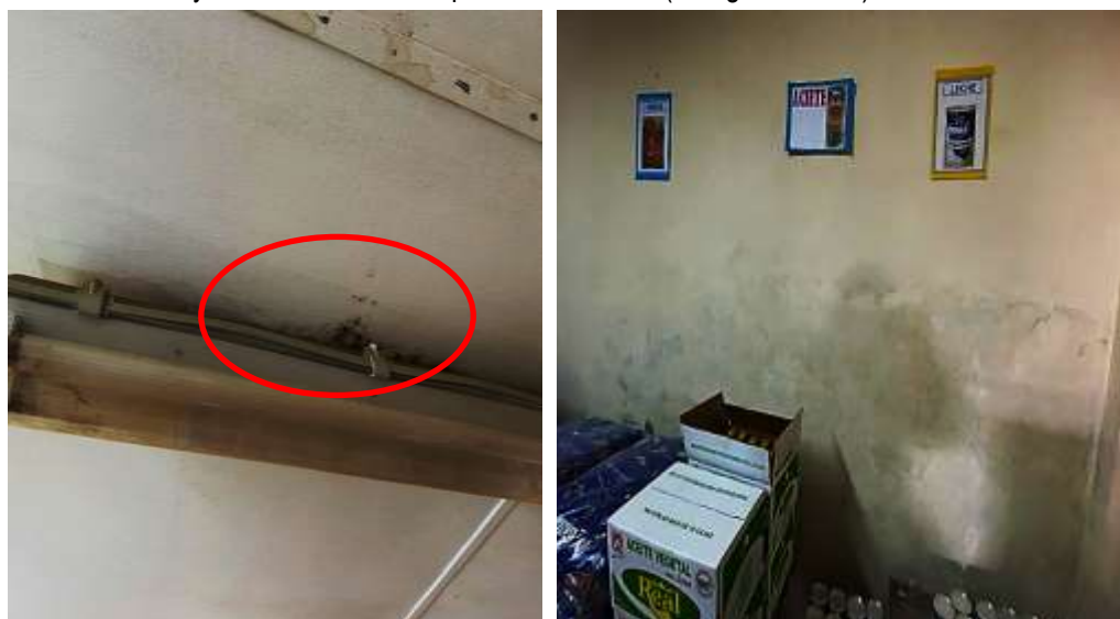
Fotografía N°21: Presencia de humedad y fisuras verticales. El techo se observa humedad y moho cerca a la lampara fluorescente.