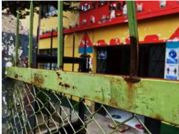
Fotografía N°02: Presencia de óxido

El enmallado es de material de acero y presenta oxidación parcial. (Fotografía N°02)