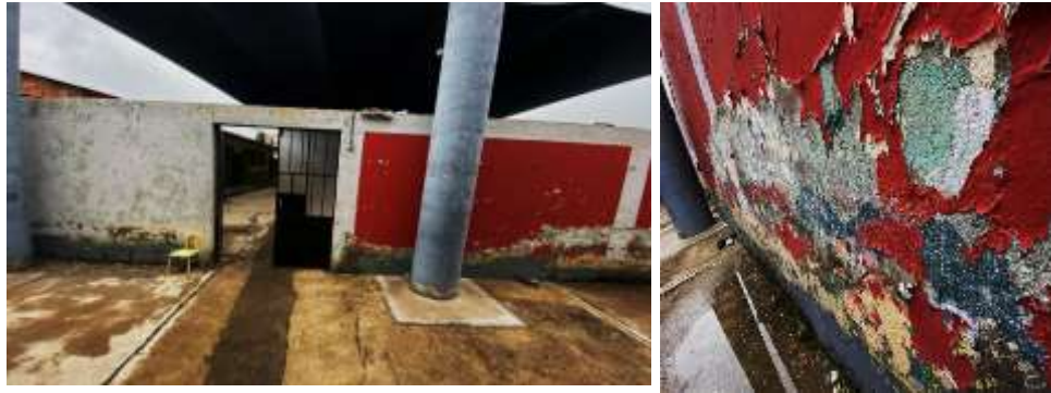
Fotografía N°05: Muro de adobe con presencia de caliche y moho verde.

Al ingresar a los pabellones de la I.E.I. Micaela Bastidas, se aprecia en el muro de adobe, la existencia del moho verde, humedad y caliche en su totalidad. (Fotografía N°05)