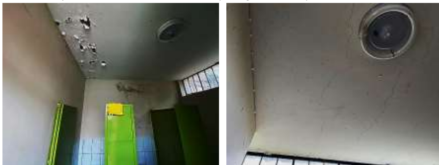
Fotografía N°27: Humedad en las hiladas superiores, desprendimiento de la pintura, detalles de fisuras verticales en unión de muro divisorio

2.7. Pabellón 3: Servicios higiénicos con material de bloquetas en muros y techo de concreto. Los muros presentan humedad en las hiladas superiores, desprendimiento de la pintura, detalles de fisuras verticales en unión de muro divisorio. En el techo se observa fisuras, humedad y desprendimiento de pintura (Fotografía N°27).