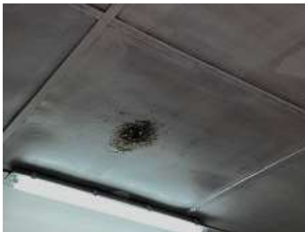
Fotografía N°11: Presencia de moho a una distancia cercana a las instalaciones eléctricas.

También se pudo presenciar el ingreso del agua proveniente de las lluvias por la puerta de entrada del aula 1.