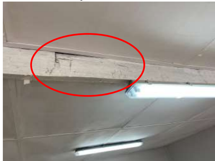
Fotografía N°24: Presencia de fisuras en la viga de madera.