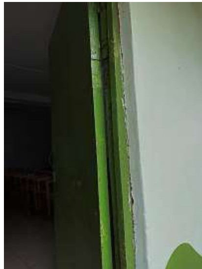
Fotografía N°26: Se visualiza grieta en unión de muro divisorio con el marco de madera de la puerta

2.7. Pabellón 3: Servicios higiénicos con material de bloquetas en muros y techo de concreto. Los muros presentan humedad en las hiladas superiores, desprendimiento de la pintura, detalles de fisuras verticales en unión de muro divisorio. En el techo se observa fisuras, humedad y desprendimiento de pintura (Fotografía N°27).