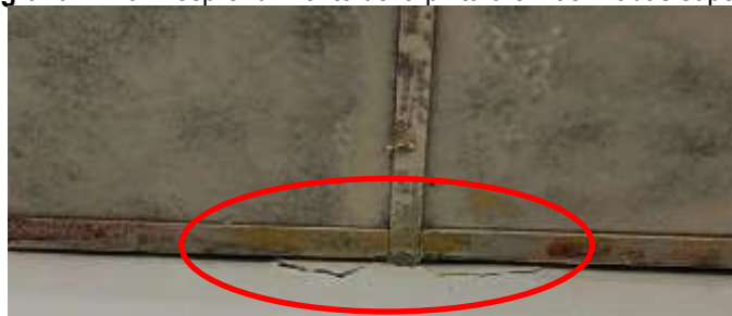
Fotografía N°14: El techo se encuentra ligeramente separado del muro y así formando una grieta horizontal