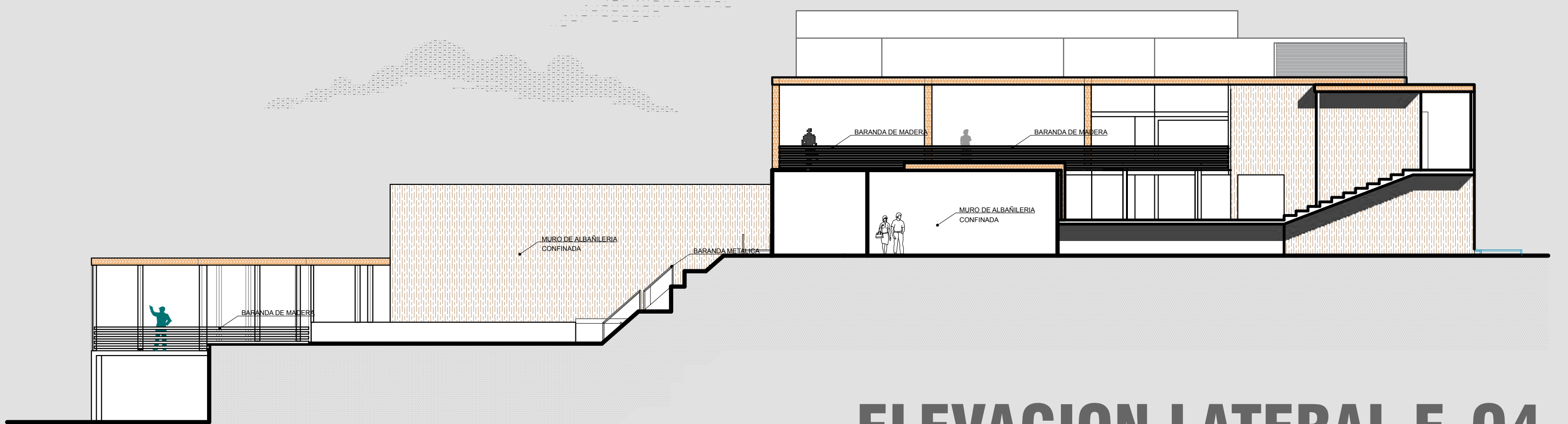
ELEVACION LATERAL E-04 1/150