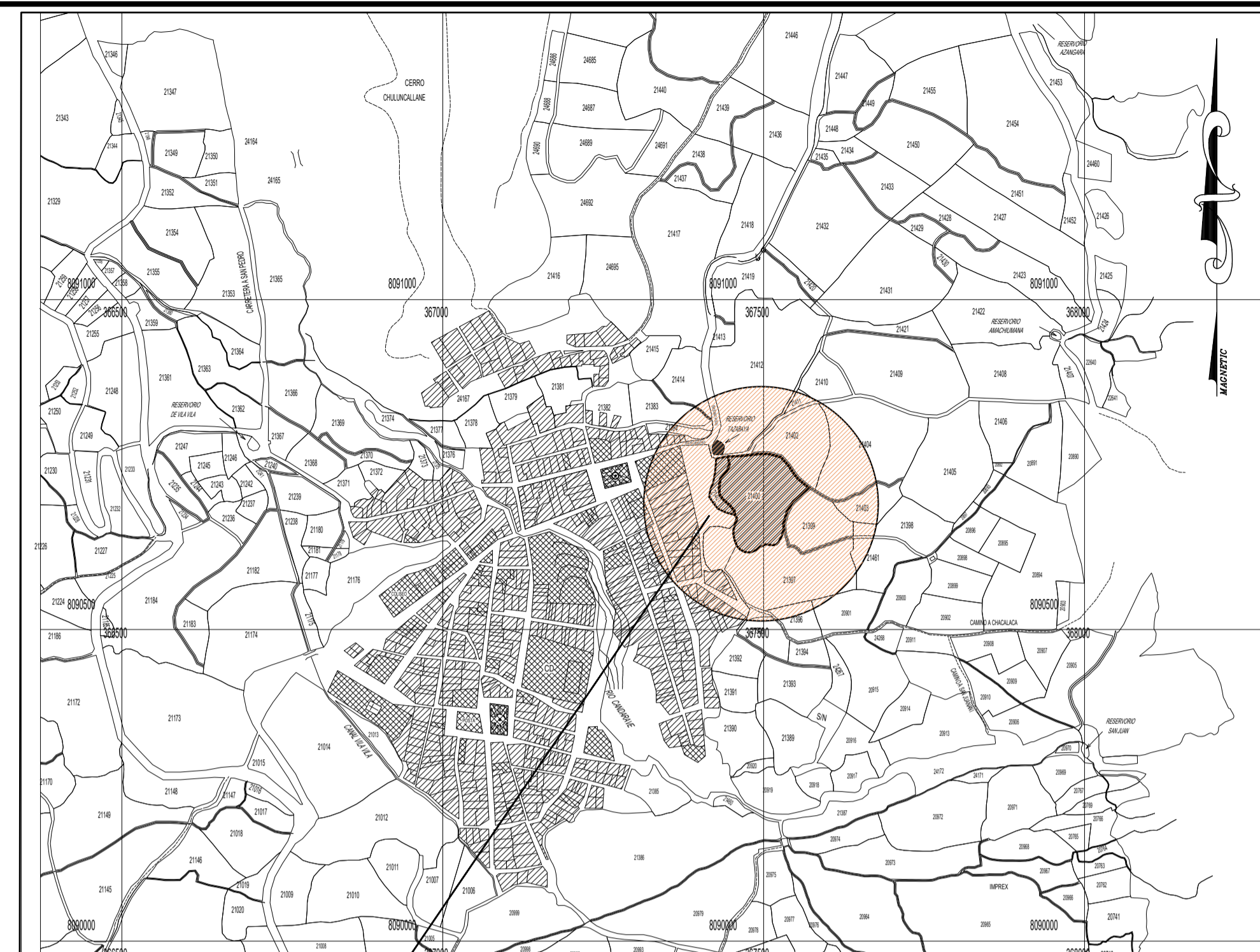
PLANO DE LOCALIZACIÓN ESC: 1 / 7 500